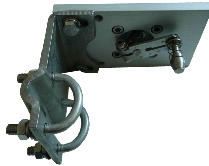
Abb.: Anbau an Guss-, Säulen- und Flachlaternen. Hub: 10 bis 35 und bis 100mm, die gezeigte Alu-Platte gehört nicht zum Anbausatz.